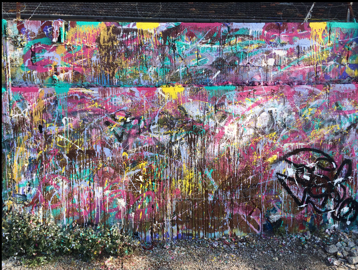
freedom of expression , 4x2 m, 2017 après les attentats