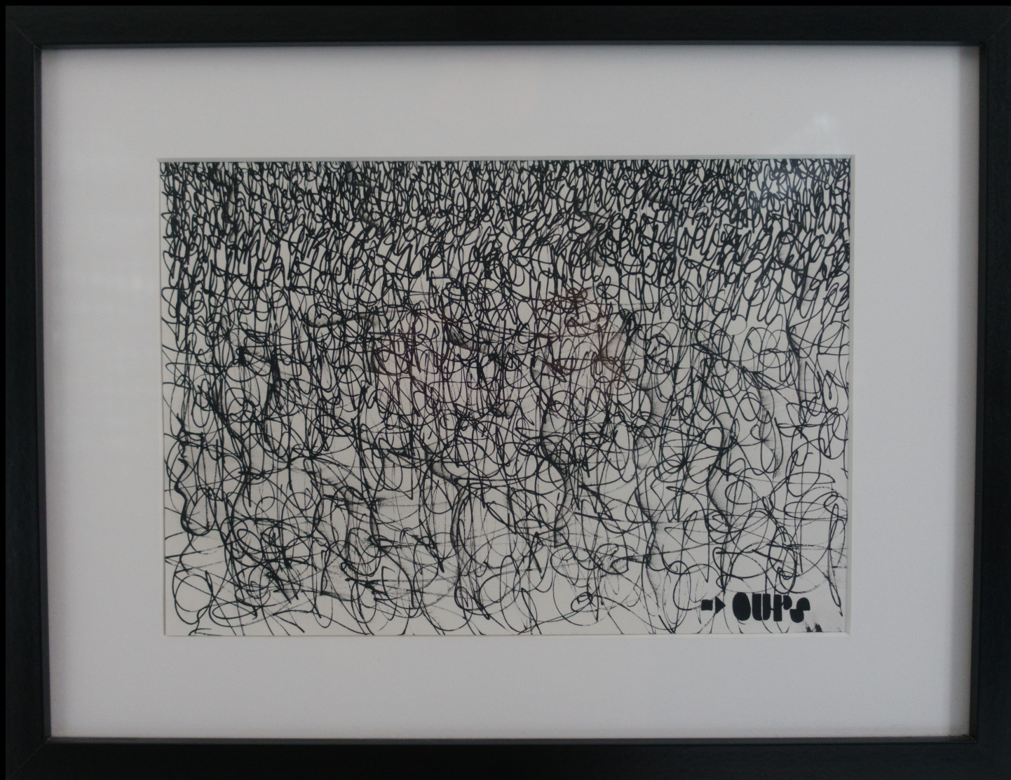
oops is good , 29,7x21 cm, 2016