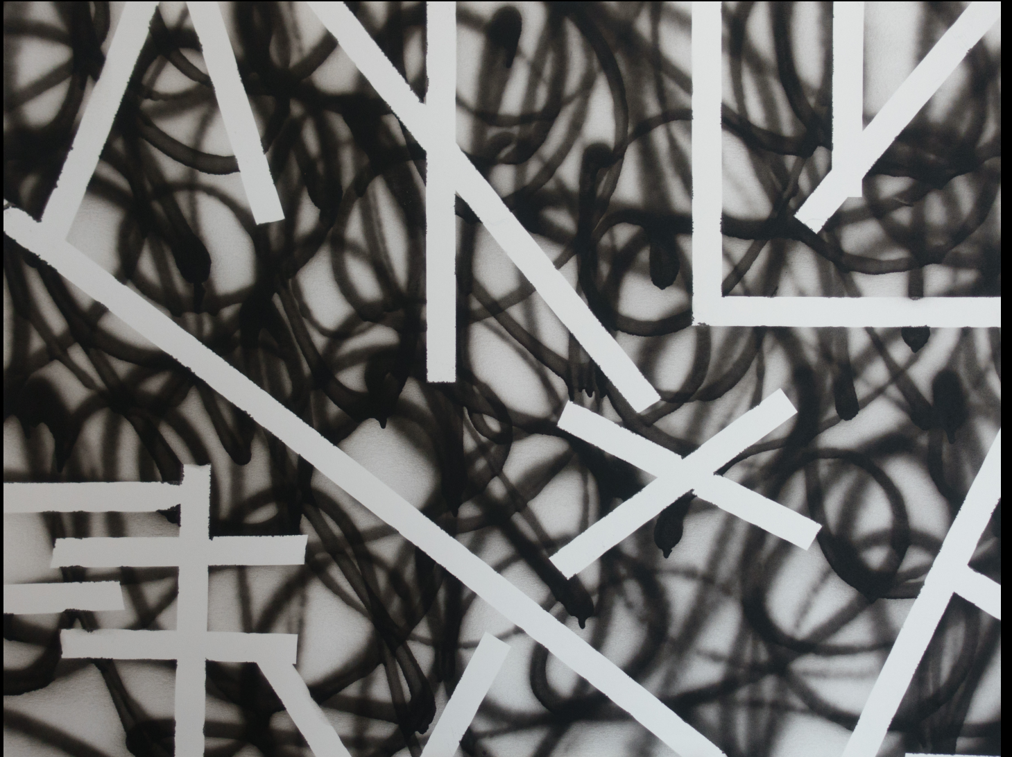
street arkitekt , 65x50 cm, 2017