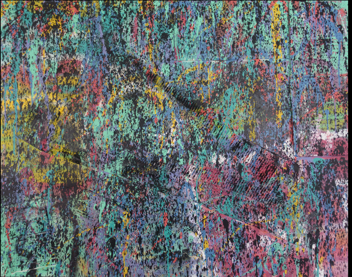
tribal street , 100x80 cm, 2017