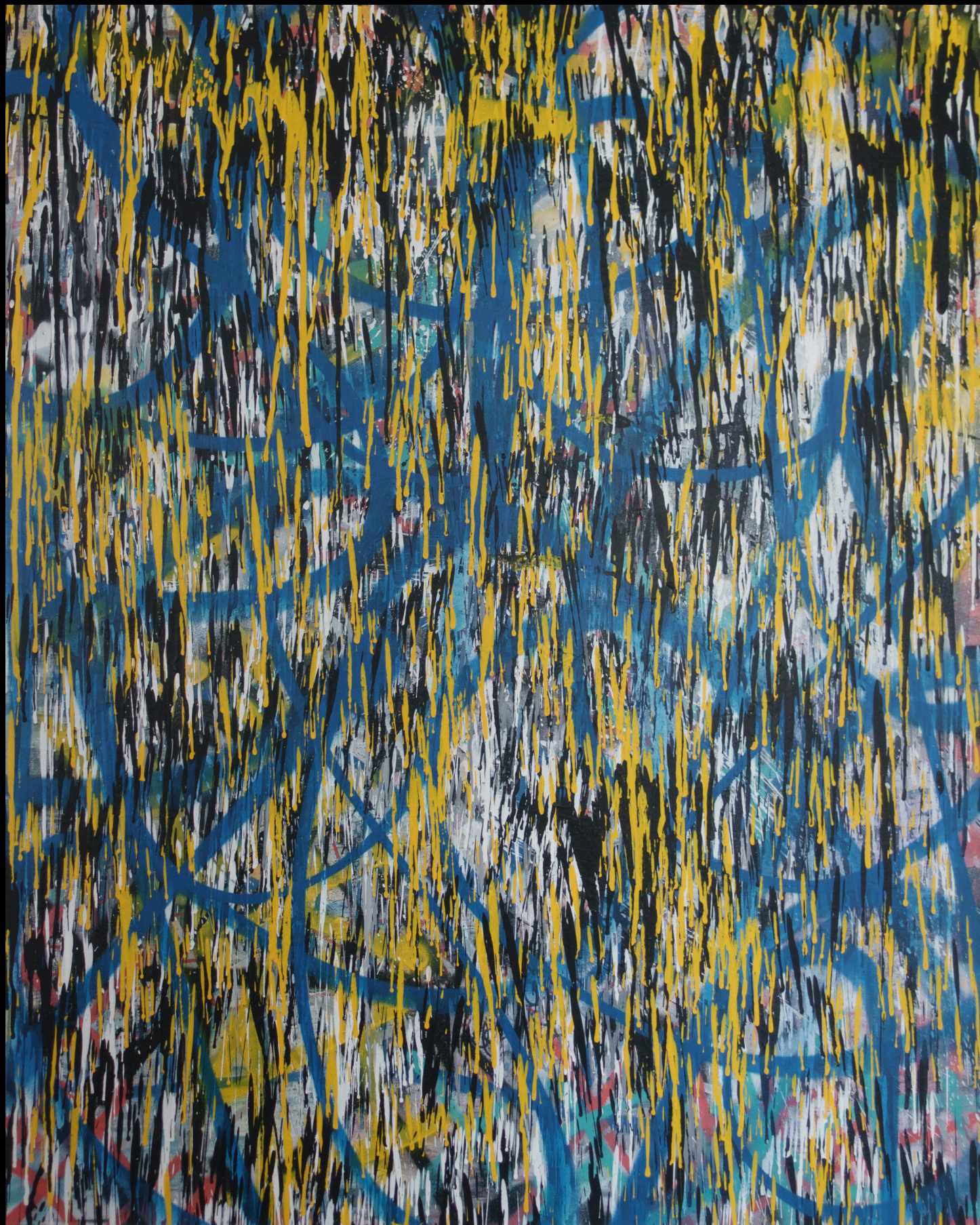
fb insta tweet blackout , 80x100 cm, 2017