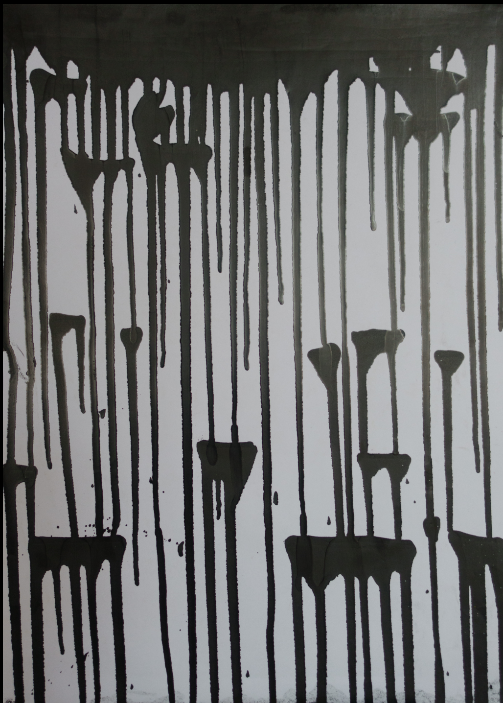
ink drips test , 29,7x42 cm, 2016