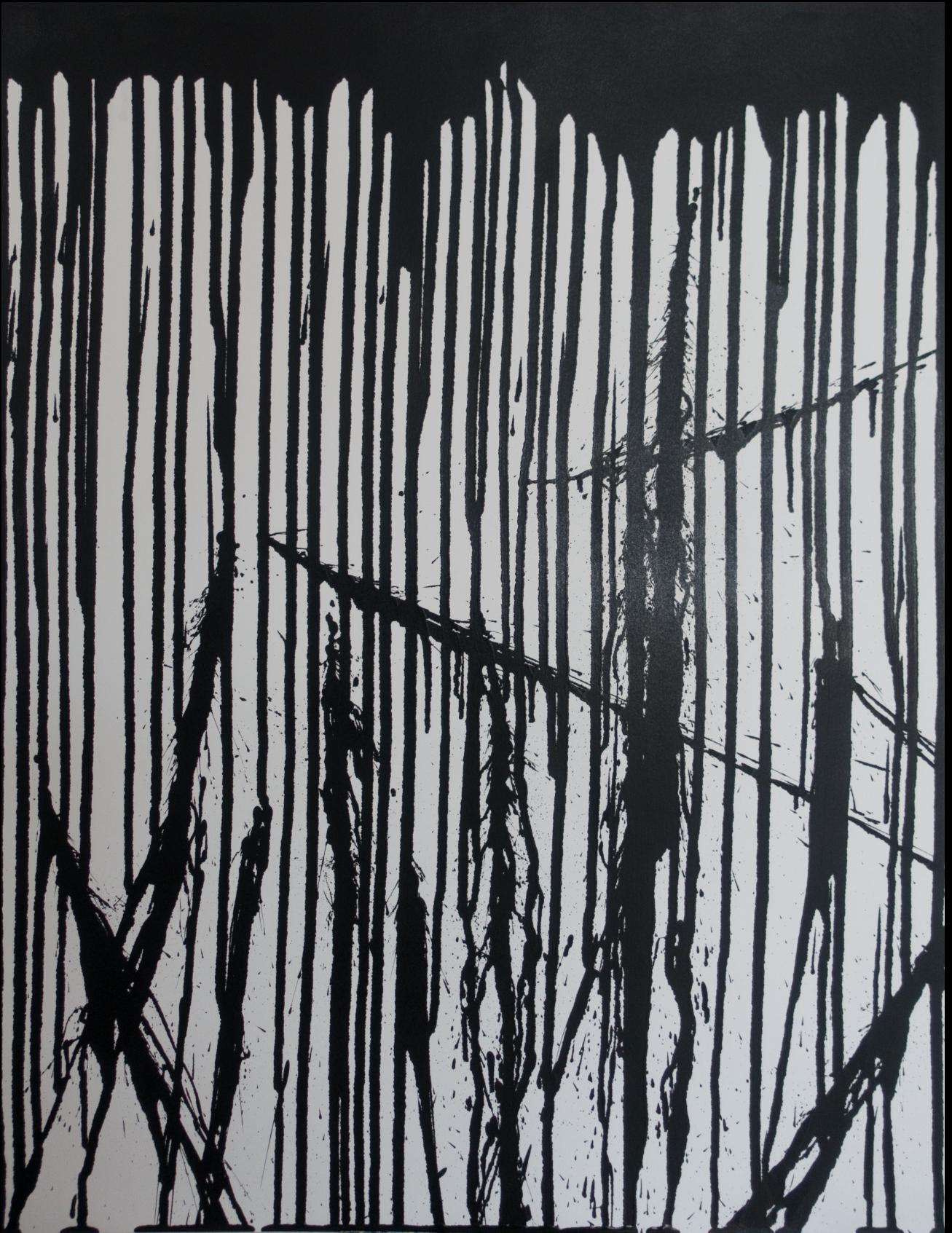
perturbations , 50x65 cm, 2017