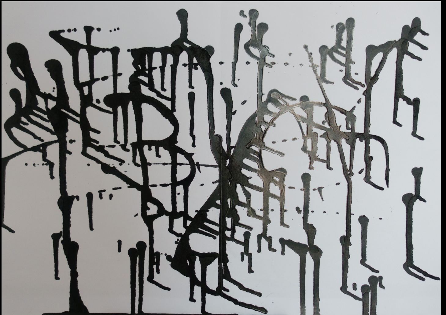
big black , 29,7x42 cm, 2016