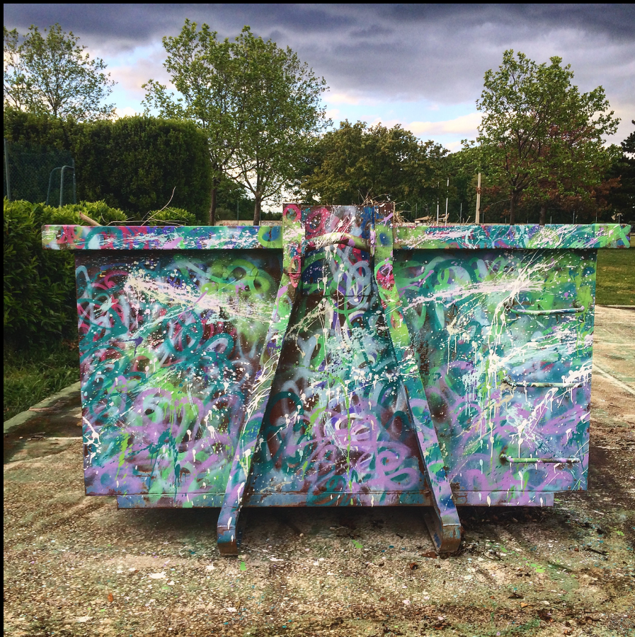
gift for the gardener, 2016