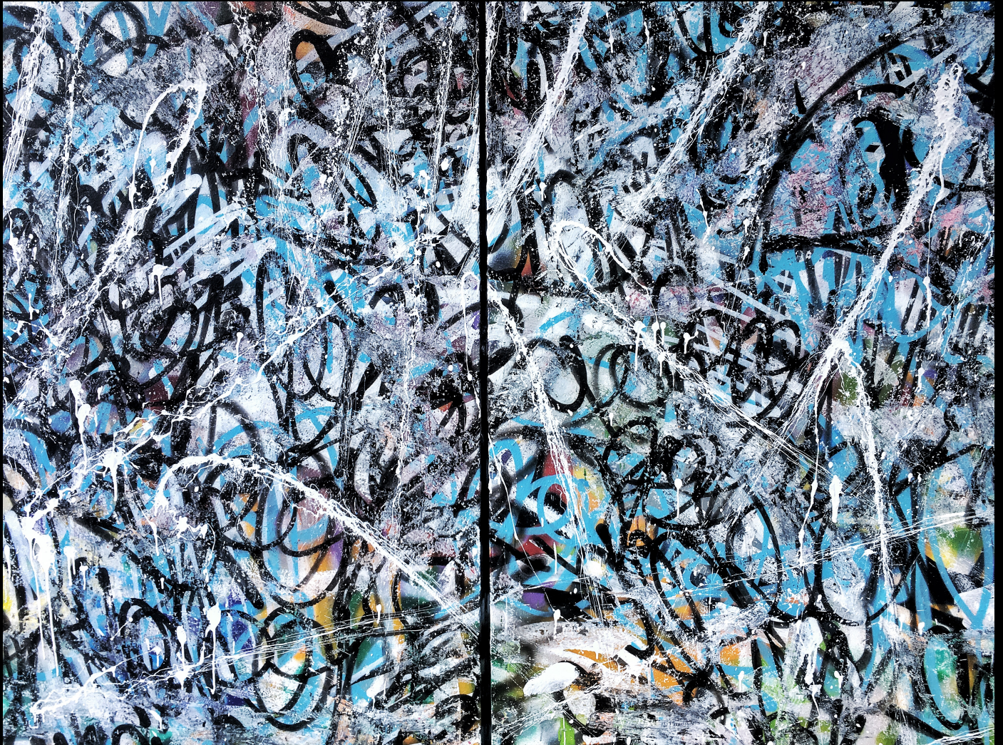
fight , 3x2m, 2018