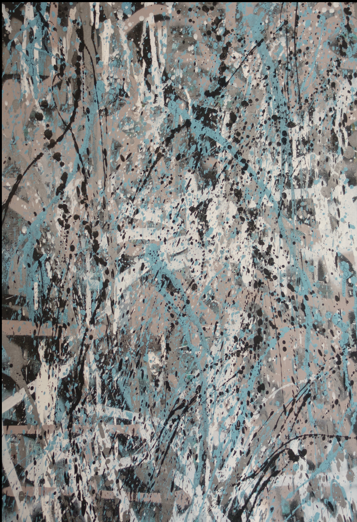
flat , 38x55 cm, 2018