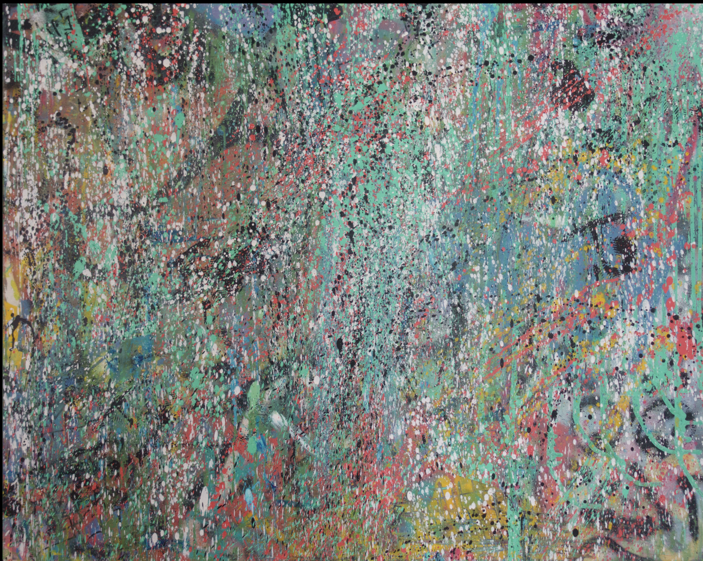
starter , 100x80 cm, 2017