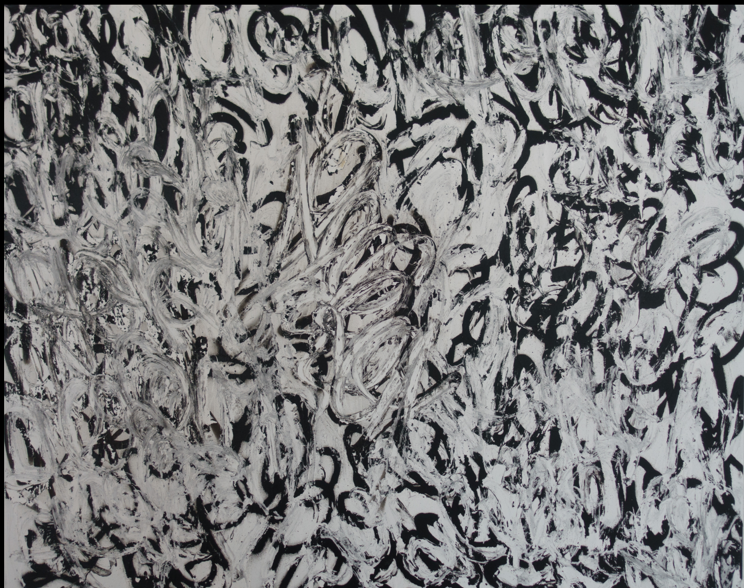
révélations , 100x80 cm, 2018